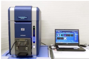
非蒸着で二次電子像や反射電子像の観察ができ、低真空下で組成分析も可能。