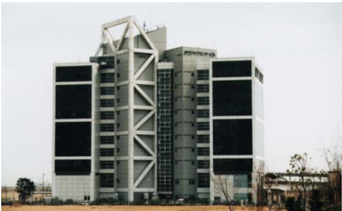
神戸キメックセンタービル