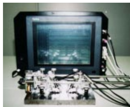
超音波探傷装置(右)