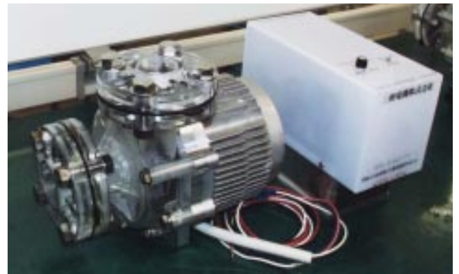
平成11年度助成企業：三相電機(株) 「ダイレクトドライブ方式の直流マグネットポンプの開発」