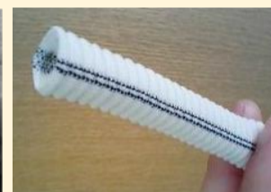
体内ではたらくプラスチック